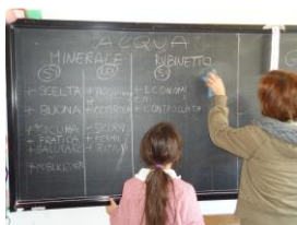
ACQUA MINERALE e ACQUA DEL RUBINETTO a confronto

Ecco allora la realizzazione di semplici terrai, di orti biologici profumati di erbe aromatiche e di orti sinergici, ecco l’allestimento di isole ecologiche all’interno delle varie aule, il recupero di cartucce esauste, il riuso di vecchi flaconi in plastica per fabbricare tanti piccoli orti portatili, l’invito al consumo dell’acqua del rubinetto, ecco la creazione di percorsi per il PIEDIBUS !