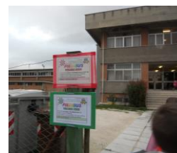
Andare a scuola con il PIEDIBUS

Questi progetti si avvalgono anche della collaborazione con enti che operano sul territorio, quali la COOP , la LUDOTECA RIÙ , la MULTISERVIZI , il COMUNE e l’ ATA RIFIUTI : uno specchio sulla realtà, che offre ai ragazzi e, a caduta, alle loro famiglie, la consapevolezza di essere costruttori e custodi di un futuro sostenibile!