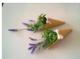
Mazzetti di lavanda coltivata nei nostri orti biologici