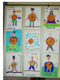
La SETTIMANA ARANCIONE : la scuola si tinge dell’arancione della ... SOLIDARIETA’

Allo stato attuale la pandemia ci impedisce di ripetere questa esperienza nelle modalità degli anni precedenti, ma il filo rosso con l’ AIRC non verrà reciso: alcune scuole provvederanno alla distribuzione di marmellate di arance e di vasetti di miele ai fiori di arancio; riteniamo infatti che l’essere solidali ( in un periodo di “chiusura” sia fisica, sia, inevitabilmente, interiore ), sia un segno di speranza da offrire, come educatori, sia ai nostri alunni, sia alle loro famiglie.